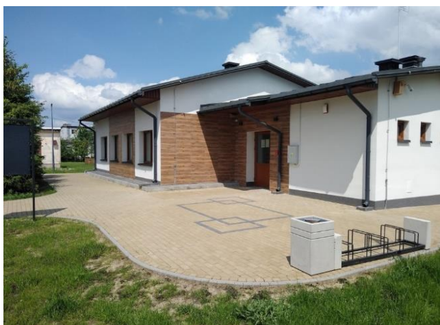
Świetlica wiejska w miejscowości Zienki