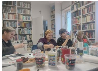
25.01.2024 r. Biblioteka w Sosnowicy