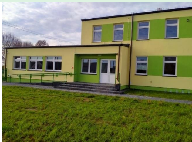
Świetlica wiejska w miejscowości Turno- Osada