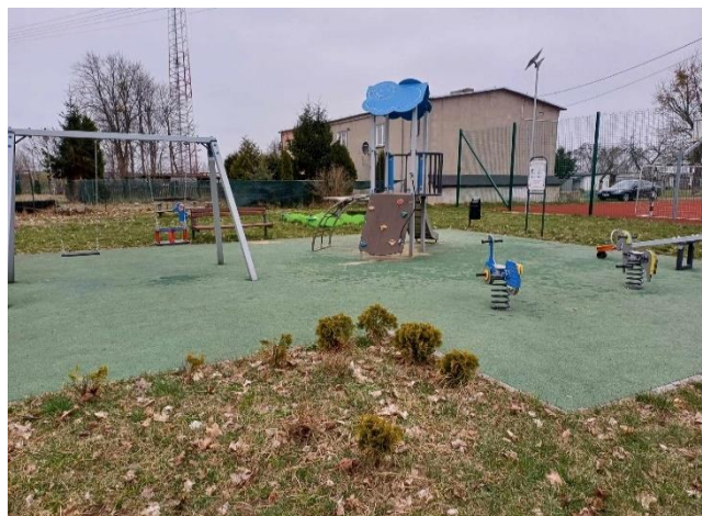
Plac zabaw w miejscowości Turno- Osada