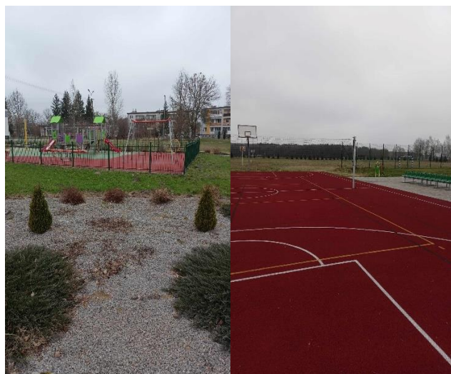
Plac zabaw i boisko w miejscowości Zienki