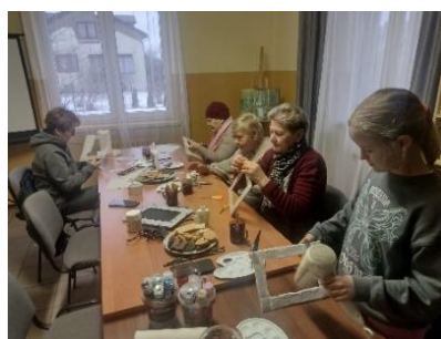
24.01.2024 r. Filia w Nowym Orzechowie