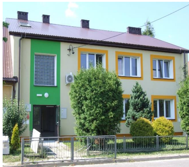
Punkt Przedszkolny w miejscowości Sosnowica

Grant zostanie wykorzystany na sfinansowanie m.in. zakupu urządzeń i usług z obszaru cyberbezpieczeństwa, szkoleń dla personelu, a także pokrycie wydatków związanych z wdrożeniem i modernizacją procedur wspierających cyberbezpieczeństwo, w szczególności Systemu Zarządzania Bezpieczeństwem Informacji. Projekt będzie realizowany przez 3 lata.