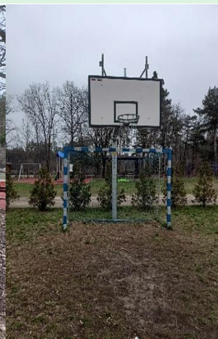
Plac zabaw, altana i boisko w miejscowości Pasieka