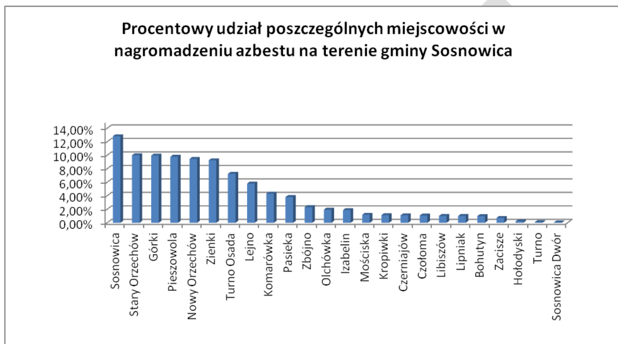
WYKRES NR 2 Procentowy udział poszczególnych miejscowości w gminie Sosnowica.