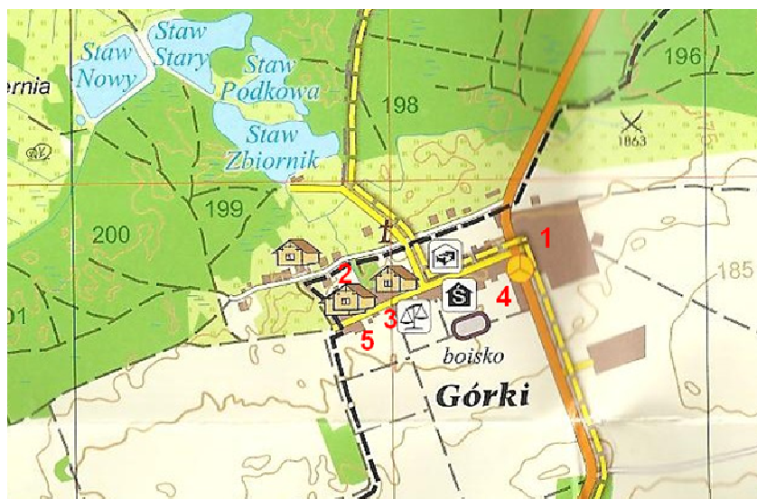
Rys. 3. Plan sytuacyjny. Górki

Układ urbanistyczny Górek jest pochodną historycznej zabudowy i zmian jakie w miejscowości zaszły w ostatnich 100 latach. Płaski teren miejscowości przecięty jest drogą łączącą Sosnowicę z Urszulinem. Od tej drogi odchodzą w kierunku zachodnim 2 drogi gminne spięte łącznikiem na zachodniej linii zabudowy. We wschodniej części miejscowości mieszczą się tereny po byłej Rolniczej Spółdzielni Produkcyjnej „Zgoda” całkowicie ją dominując. W południowej części miejscowości po prawej stronie jadąc w kierunku Urszulina zlokalizowanych jest kilka bloków mieszkalnych.