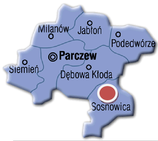
Rys. 1. Gmina Sosnowica na tle powiatu parczewskiego

Górki to wieś położona we wschodniej części województwa lubelskiego, w powiecie parczewskim, w gminie Sosnowica. Miejscowość jest zlokalizowana w strefie najwyższej atrakcyjności turystycznej wyznaczonej przez Plan Marketingu Turystyki w Województwie Lubelskim na lata 2007-2013.